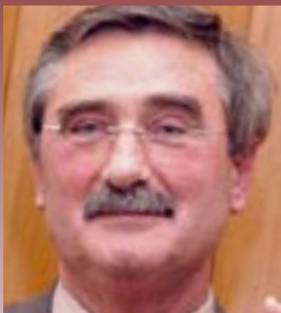
Rolf Linsler, Landesvorsitzender der Linken im Saarland

„Wir begrüßen alle Investitionen, mit denen Saarbrücken aufgewertet wird. Dies darf aber nicht zu Lasten sozialer Ausgaben gehen.“