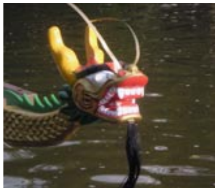
Verswindet die Drachenboot-Schnauze aus dem Stadtbild?

men. Dennoch entschloss man sich zu diesem Pilotprojekt. Die „Saarbrücker Zeitung“ berichtete am 5. August 1999: „Das Gewässer, das der 1000-Jahr-Stadt Saarbrücken ihren Namen gibt, steht im Mittelpunkt eines Veranstaltungs-Spektakels, das am Freitag beginnt und am Sonntagabend endet. Das Saar-Spektakel am Saarkran zwischen